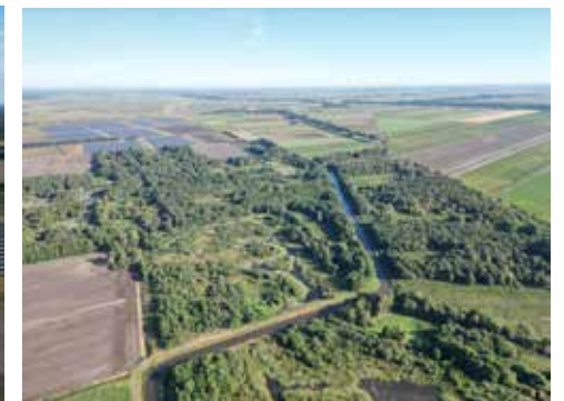
Binnen de Zoerse landen wordt het huidige beekprofiel aangepast met natuurvriendelijke oevers.