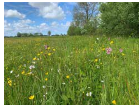
Kruiden- en faunarijke grasland