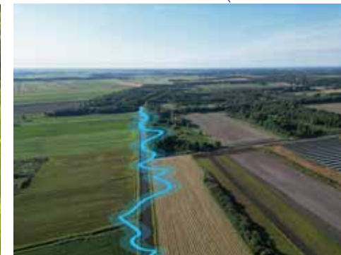
Schematisch weergegeven hermeandering van de oude beekloop ter plaatse van de huidige loop tussen Zoerse landen en de Oude dijk.